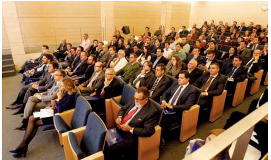
A la izquierda, recepción de asistentes. En la imagen de la derecha, panorámica del salón de actos de la Escuela Internacional de Gerencia, completamente lleno.